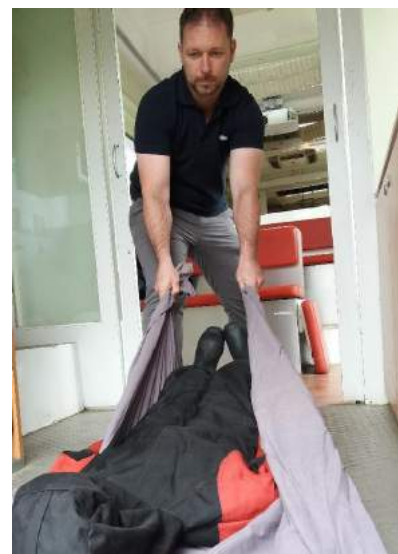
Une pédagogie active s'appuyant sur des mises en situation réelles