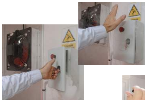
S'exercer à manipuler un extincteur à eau pulvérisée et CO2