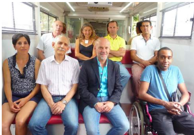
Huit stagiaires par session > véhicule accessible aux personnes en situation de handicap