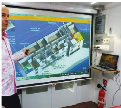
L'étude interactive d'un sinistre est la pédagogie la plus efficace pour ancrer les connaissances théoriques.